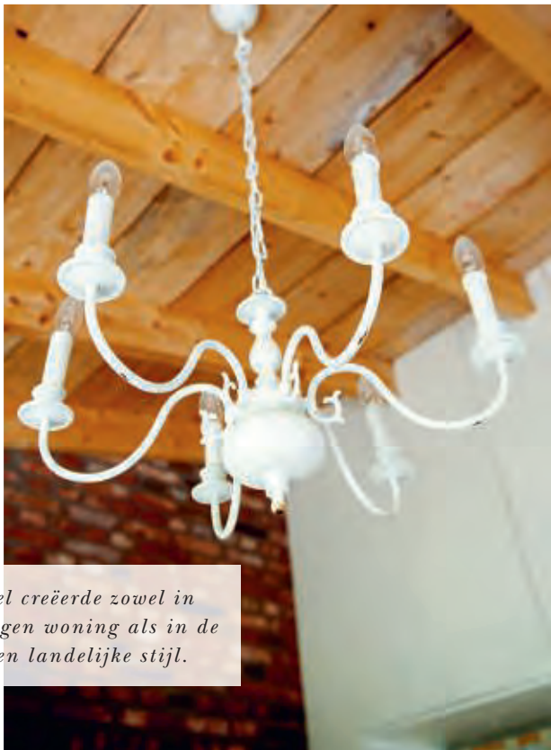
Het stel creëerde zowel in hun eigen woning als in de b&b een landelijke stijl.