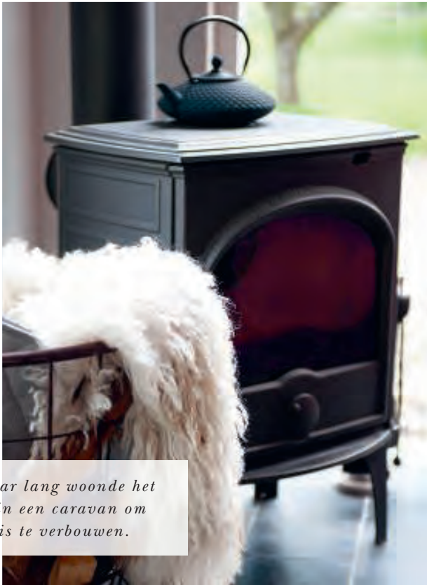
Een jaar lang woonde het gezin in een caravan om het huis te verbouwen.