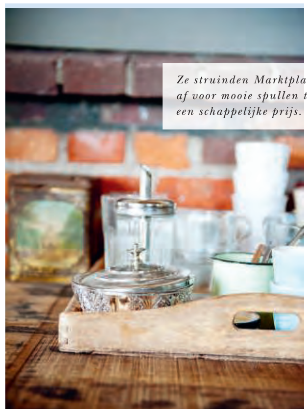
Ze struinden Marktplaats af voor mooie spullen tegen een schappelijke prijs.